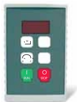
zewnętrzny moduł obsługi